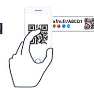
QR Code (disponible directement sur la borne)